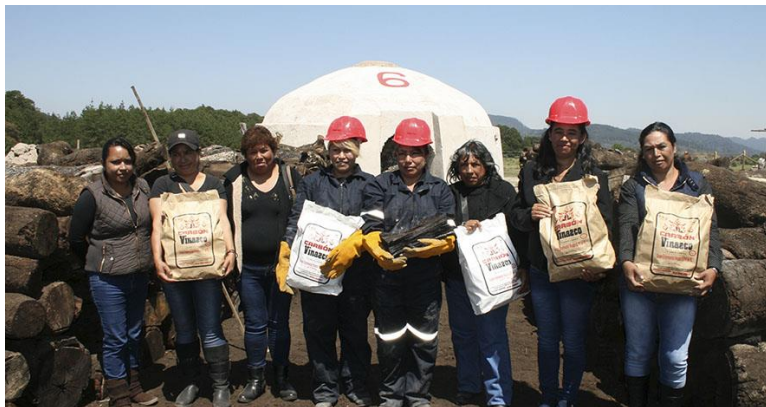
Foto 7. Mujeres empleadas de la empresa con sus productos.