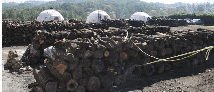
Foto 1. Madera lista para transformarse en carbón, junto a los hornos del ejido.

Bajo el concepto de Gestión Integrada del Paisaje, se definen mecanismos específicos para garantizar la colaboración de múltiples actores (gobiernos locales, empresas privadas), con el objeto de alcanzar un paisaje sostenible y facilitar el acceso a mercados diferenciados formados principalmente por industrias privadas.