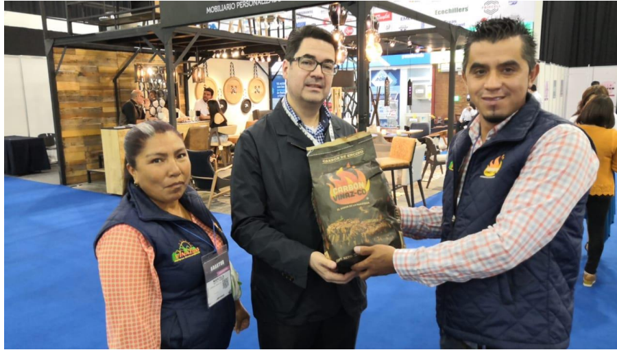
Foto 6. Asistencia y participación en la Expo Forestal 2018.