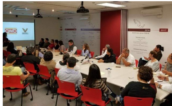
Foto 4 y 5. Reuniones y proceso de Compras verdes con OXXO.