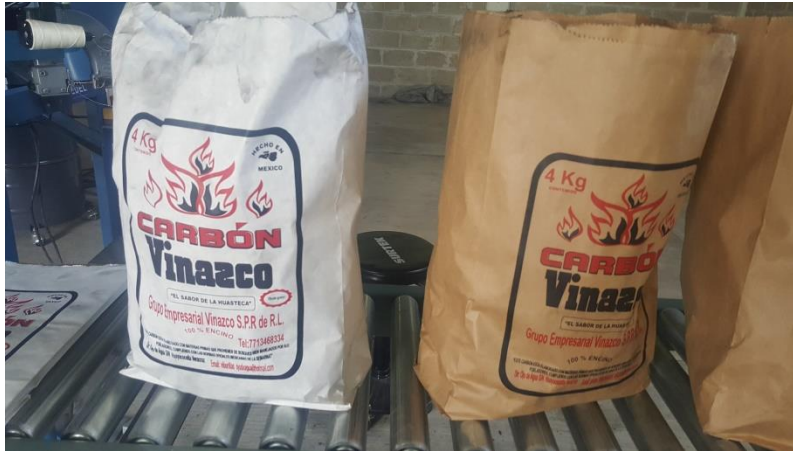
Foto 2. Producto de Carbón Vinazco.

comunitarias con compañías de distribución de productos a nivel estatal y nacional.