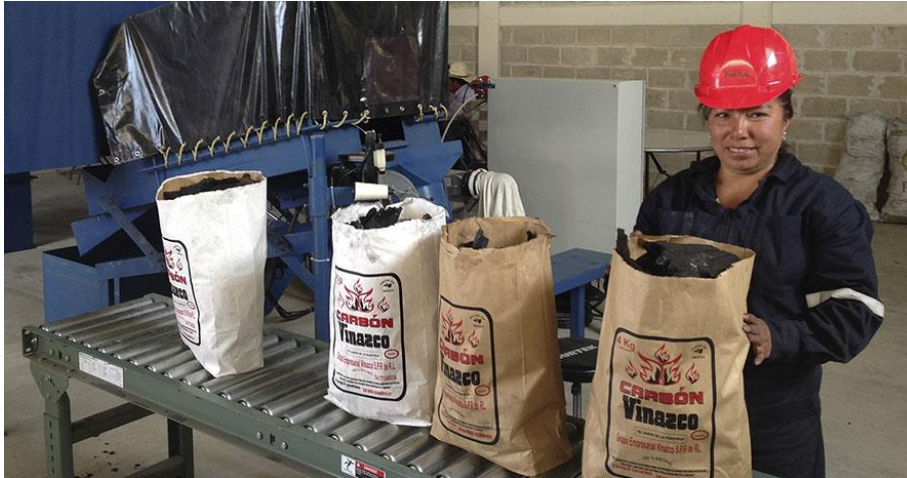
Foto 3. Mujer empleada del Grupo Empresarial Vinazco.