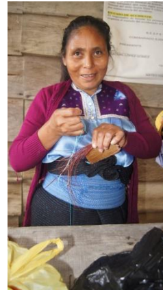
Foto 1 y 2. Artesanías con hoja de pino y cultivo de hongos comestibles llevado a cabo por mujeres del Ejido Monte Sinaí.