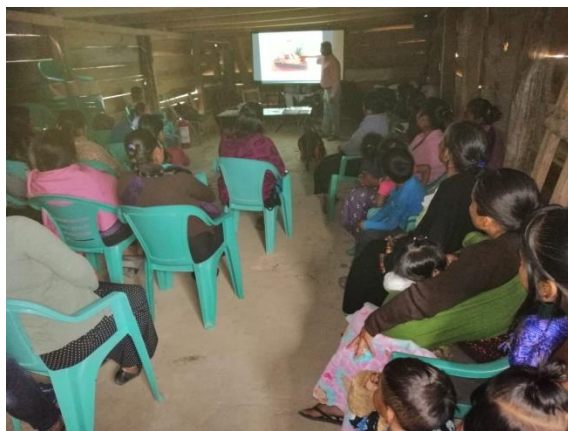
Foto 5 y 6. Capacitaciones en el tema de cultivo de hongos y elaboración de artesanías con hoja de pino en el Ejido Monte Sinaí, en Chiapas.