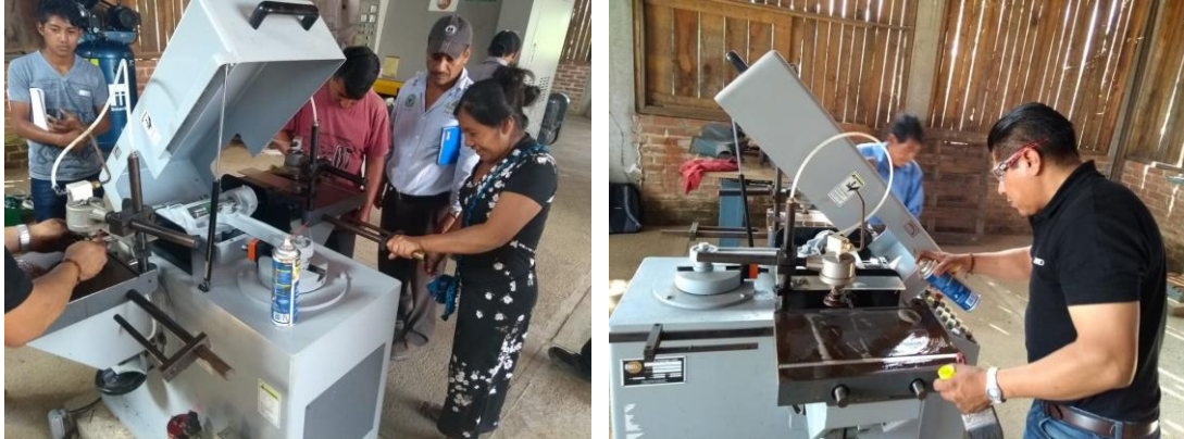
Foto 9 y 10. Taller de capacitación para operadores de las máquinas del taller de carpintería del Ejido Monte Sinaí.