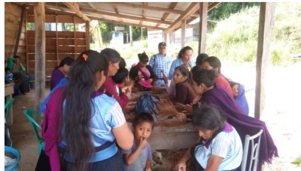
Foto 7 y 8. Artesanías de hoja de pino listas para su venta en bazares locales.