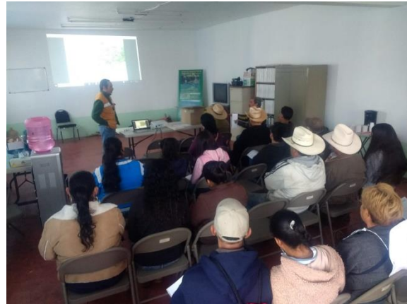
Foto 5 y 6. Actividades de capacitación impartidas por personal del proyecto a integrantes del Ejido Gómez Tepeteno.