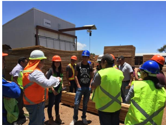
Foto 4. Actividades de aserrío y transformación en el Ejido Gómez Tepeteno, Puebla.

Sin embargo estas características del aserradero, únicamente les permite industrializar los productos primarios; mientras que los productos secundarios se comercializaban sin valor agregado en otras industrias forestales.