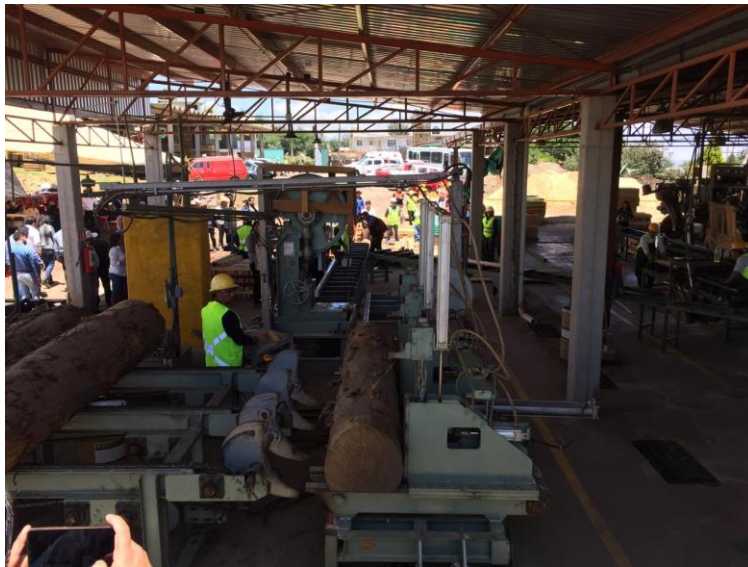
Foto 3. Industria del Ejido Gómez Tepeteno, Puebla,

La EFC consolidó inversión por un monto de $2.5 millones de pesos para la adquisición e instalación de equipo y maquinaria diseñada para procesar los productos secundarios de los aprovechamientos maderables así como parte de los residuos del aserradero principal y con ello diversificar la oferta de productos maderables.