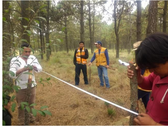
Foto 8 y 9. Capacitación en actividades de monitoreo y prácticas de conservación de la biodiversidad.