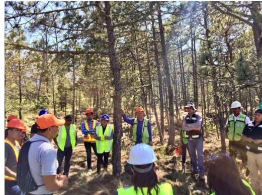
Foto 1 y 2. Actividades del Ejido Gómez Tepeteno, Puebla.