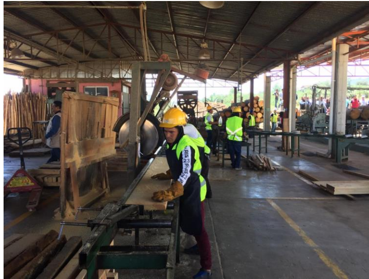
Foto 7. Equipo adquirido por el Ejido Gómez Tepeteno, Puebla.