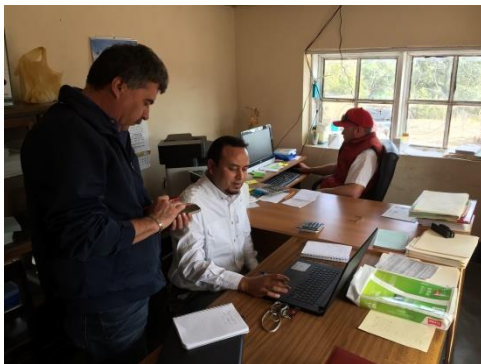
Foto 4 y 5. Acompañamiento proyecto al ejido Caborachi.

el trabajo, implementación del software “Sistema de Control Contable, Financiero y de Producción en la Operación de las Empresas Forestales”, monitoreo socio económico, Motivación y desarrollo de proyectos para mujeres, elaboración del Coeficiente de Asierre.