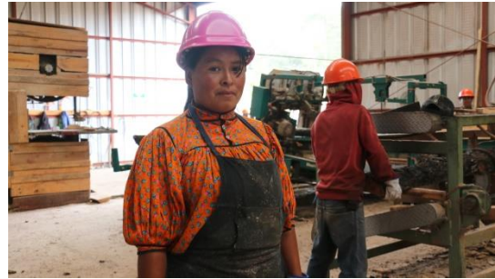
Foto 6 y 7. Participación de mujeres en la industria de Caborachi, Chihuahua.