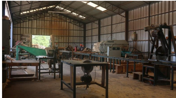
Foto 3. Industria Caborachi, Guachochi, Chihuahua.

Actualmente el Ejido Caborachi cuenta con industria forestal moderna, con una capacidad instalada de 12,000 pies tabla por turno, en la cual se obtienen diferentes productos como madera aserrada de largas y cortas dimensiones, dimensionado para tarima, caja de empaque, cuadrado para escoba, polín, durmiente y astilla. Las ventas anuales oscilan entre los 16 millones de pesos.