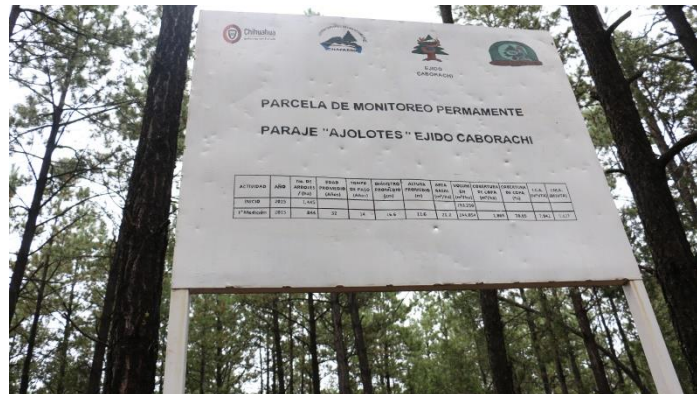
Foto 1. Trabajo del campo del Ejido Caborachi, Municipio Guachochi, Chihuahua.

Las empresas forestales comunitarias, cuya administración marcha con éxito, desarrollan confianza que favorece la cooperación y la coordinación del manejo, aprovechamiento y conservación de los recursos forestales comunitarios, fortalece la gobernanza comunitaria, creando reglas coherentes a las condiciones ambientales, sociales y económicas el territorio, promoviendo la participación activa de los integrantes en la definición de estas reglas, su cumplimiento y aplicación de sanciones y resolución de conflictos.