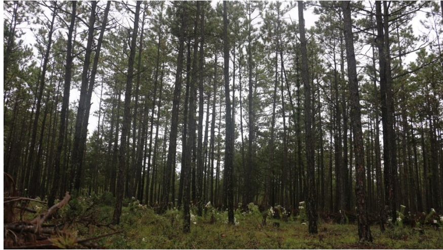
Foto 2. Bosque de ejido Caborachi, Guachochi, Chihuahua.