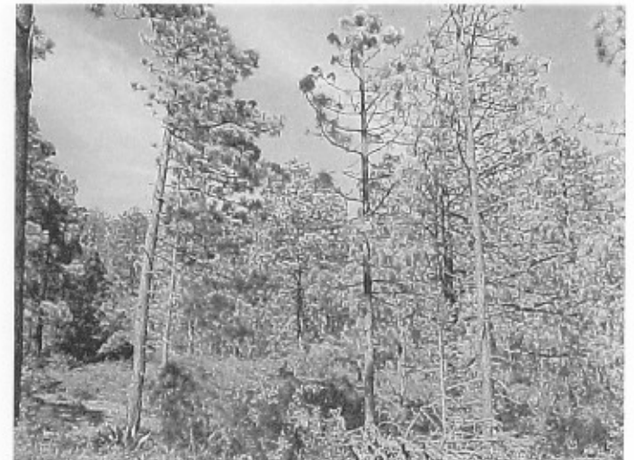
Figura 1. Bosque de Pinus rudis atacado por Dendroctonus adjunctus en la Sierra de Arteaga, Coah.

para ser afectado por algún insecto o patógeno forestal, lo que ha traído como consecuencia que existan las condiciones ideales para que la población de insectos descortezadores alcancen proporciones capaces de afectar tanto el aspecto económico como el ecológico y social de este ecosistema. Esta plaga se hizo presente en 1999 afectando más de 400 hectáreas en la Sierra de Arteaga, Coahuila. La infestación se presentó en manchones, lo cual favoreció su rápida diseminación, originando que las poblaciones de descortezadores pudieran crecer rápidamente e infestar miles de árboles en poco tiempo (Figura 1).