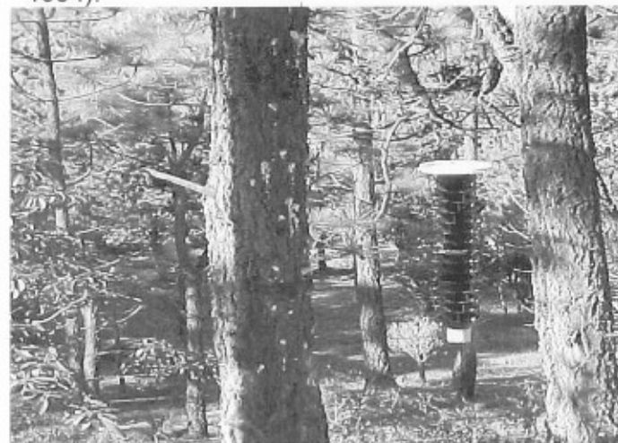
Figura 3. Trampa "Lindgren" cebada con feromonas de atracción sexual en brote activo de D. adjunctus en la Sierra de Arteaga, Coah.

Se han desarrollado nuevos e innovadores planes de manejo de descortezadores con el uso de atrayentes sexuales sintéticos, que están ahora disponibles en el mercado para manipular y monitorear poblaciones de descortezadores. El uso de cebos y trampas con feromonas (Figura 3) ha permitido a los técnicos contener pequeños brotes de infestaciones y de esta manera evitar el esparcimiento a rodales susceptibles, manteniendo las poblaciones de descortezadores en niveles bajos (Safranyik and Hall, 1990; Hayes and Strom, 1994).