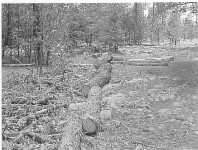
Figura 2. P. rudis tratado con el método de saneamiento tradicional (derribo-troceo-químico), en la Sierra de Arteaga, Coah.

Las acciones emprendidas para controlar los diversos brotes originados por estos insectos se basaron en la aplicación de métodos directos tradicionales reglamentados por la SEMARNAT, que implica el derribo del arbolado infestado y la utilización de un producto químico, método cuestionado ampliamente por la sociedad, además de los altos costos que genera su aplicación (Figura 2). Sin embargo, actualmente no se cuenta con mejores opciones, como pudiera ser la implementación de un método que incluya el uso de diversos productos químicos, biológicos y feromonas sexuales.