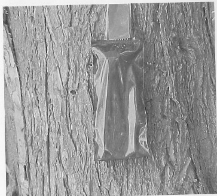
Figura 6. Arbol-trampa con feromona sexual adherida al fuste.

insecticida sistémico directamente en el floema del árbol. El insecticida deberá ser de translocación floema-xilema, debido a que la zona del cambium en los árboles de coníferas sólo cuenta con conductos vasculares de floema.