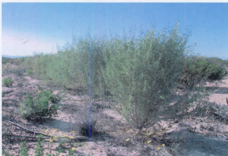
Plantación de chamizo dos años después del trasplante. Rancho "El Jeromín". Aldama, Chih.