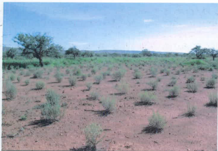
Plantación de Chamizo un año después del trasplante. Rancho "La Laborcita", Mpio. de Santa Bárbara, Chih.