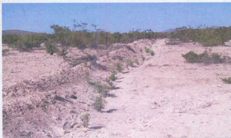
Plantación de chamizo en agostadero, en bordos a nivel y sin riego auxiliar. Rancho "El jeromín", Aldama, Chih.

Cuando la plantación se va a realizar con la humedad de las lluvias y con obra de captación de humedad por medio de bordos a nivel, estos se deben de hacer antes de la temporada de lluvias para que capten agua desde el inicio del temporal lluvioso. Al igual que en el método de plantación sin obra de captación de humedad, el momento adecuado para plantar es cuando el suelo está húmedo y también es necesario realizar un muestreo para verificar que la humedad en el suelo haya bajado 20 cm. Los bordos se hacen siguiendo un mismo nivel en el terreno a una distancia de 3 metros entre sí, aunque esta distancia puede variar según las condiciones del terreno; los arbustos se plantan en hoyos que deben hacerse en la parte baja del bordo que es donde se capta la mayor cantidad de agua. Esta forma de plantación con obra de captación de humedad ofrece una mayor garantía de que los arbustos plantados sobrevivan pues la cantidad de agua captada es muy significativa para el arraigo y desarrollo de los chamizos.