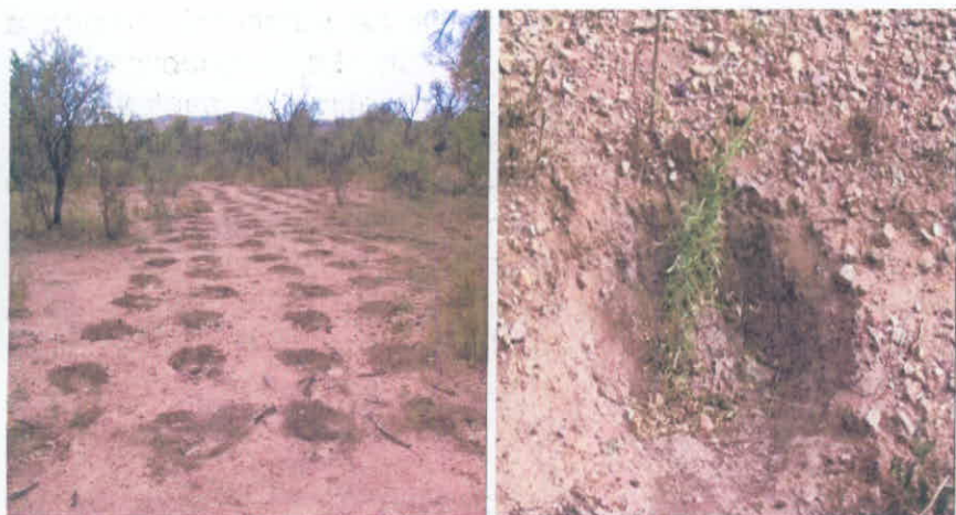
Plantación de chamizo en agostadero, sin obra de captación de humedad y con riego auxiliar, Rancho "Amaya", Parral, Chih.

En el terreno no se realiza ninguna preparación del suelo, ni desmontes, ni barbechos, solo se hace un hoyo de unos 20-30 cm de profundidad con un talacho, pico, pala, o azadón, de tal forma que quepa el cepellón (tierra y raíces) de la planta de chamizo. Si el terreno no es muy duro pueden hacerse los hoyos antes de que se presenten las lluvias, esto facilita que la cepa capte más agua y tenga mayor humedad al momento de la plantación.