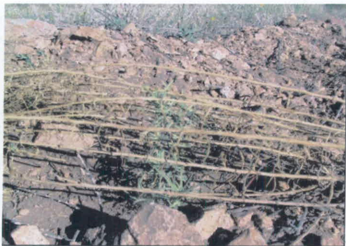
Protección con cubierta de ramas contra liebres