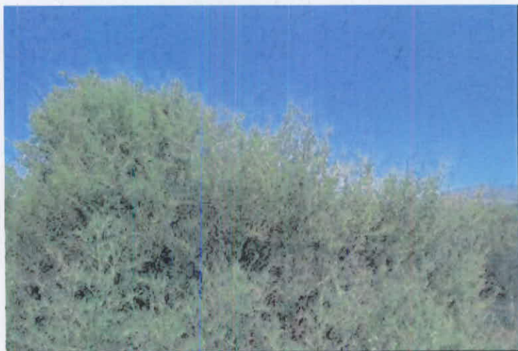
Los rebrotes de chamizo son una fuente importante de forraje durante la época crítica