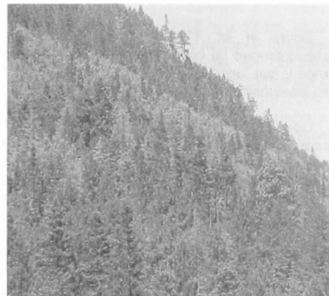
Figura 1. Bosque de Pseudotsuga flahaulti dañado por Dendroctonus pseudotsugae en la sierra de Arteaga, Coah.

Debido a la importancia de esta especie para los bosques del estado de Coahuila, el INIFAP ha llevado a cabo investigaciones encaminadas a desarrollar alternativas para el manejo de esta especie de descortezador, las cuales están dirigidas a la protección y conservación de estos ecosistemas.