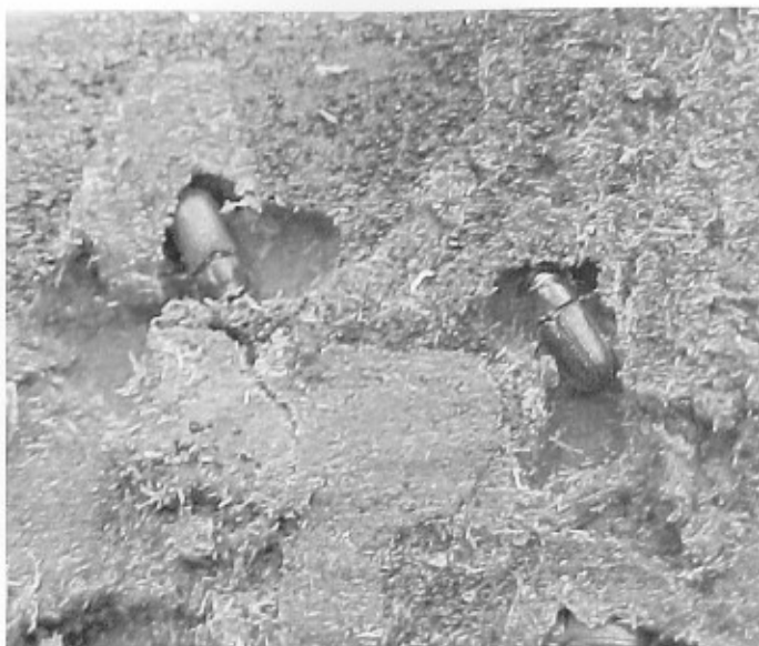
Figura 2. Adulto de Dendroctonus pseudotsugae en Pseudotsuga flahaulti

requiere de 23 días y se desarrolla durante el mes de julio. Posteriormente, pasa al estado de adulto, en su fase de imago (antes de emerger del árbol). En esta requiere un período de 20 días, lo cual ocurre a finales de julio y principios de agosto; finalmente, el estado de adulto (fase en la cual emerge del árbol) abarca un período de 16 días, hasta finales de agosto, concluyendo en este mes su ciclo de biológico.