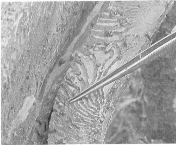
Figura 5. Galerías secundarias y larvas de Dendroctonus pseudotsugae del segundo estado en Pseudotsuga flahaulti en la sierra de Arteaga, Coahuila.

Esta especie presenta cuatro estados larvales y permanecen alimentándose en la zona del cambium durante su desarrollo. Posteriormente, durante el último estado construye una celda al final de la galería, que es donde cambia al estado de pupa (Figura 6). De estas pupas emergen los imagos que, posteriormente, en un período de 15 a 20 días, pasan al estado de adulto, los cuales perforan la corteza hasta llegar al exterior para finalmente iniciar su dispersión.