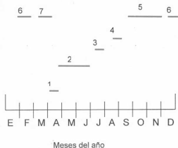
Figura 3.- Meses en que se presentan los diferentes estados de desarrollo de Dendroctonus pseudotsugae en la sierra de Arteaga, Coah.

Su ataque provoca la muerte de árboles maduros, viejos y estresados (principalmente por sequía o incendios) en rodales naturales sin manejo.