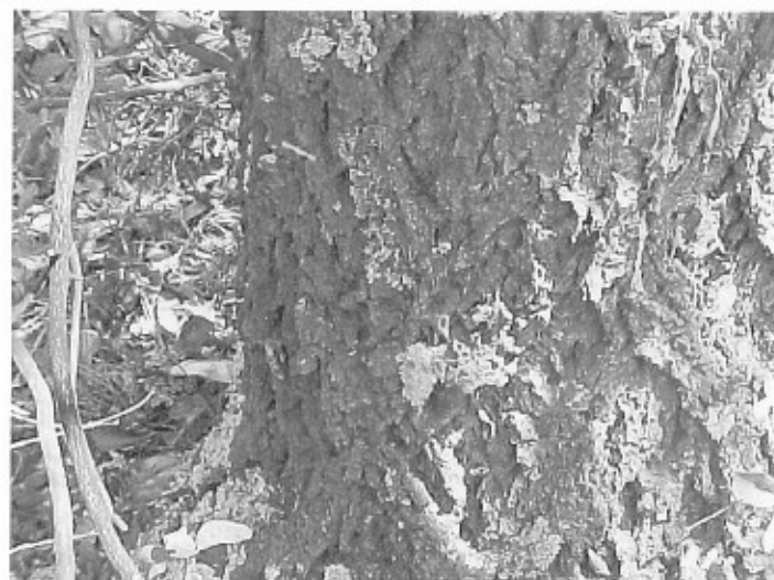
Figura 4. Aserrín en la base del fuste, síntoma de ataque de Dendroctonus pseudotsugae en Pseudotsuga flahaulti en la sierra de Arteaga, Coahuila.

El ataque lo inicia durante los meses de abril y mayo, período en el cual las hembras colonizan a su hospedero susceptible, (viejos, menos vigorosos, débiles y enfermos).