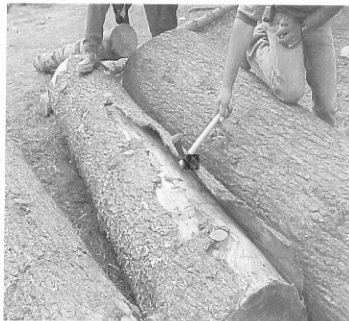
Figura 7. Tratamiento silvícola (derribo-troceo-descortezado) en Pseudotsuga flahaulti dañado por D. pseudotsugae en la sierra de Arteaga, Coahuila.

Asimismo, es importante denotar que los árboles derribados durante este período y que no sean descortezados, deberán de ser extraídos del predio o sitio afectado, debido a que en este estudio también se determinó que el ciclo biológico lo concluye desde huevecillo hasta adulto aún en árboles derribados.