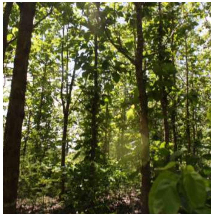
Figura 3. Parcela 7 en predio Hacienda Dzizhila