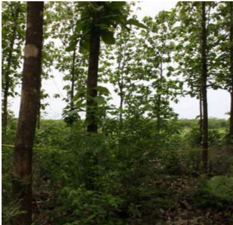
Figura 2. Parcela 5 en le predio Hacienda Dzizhila