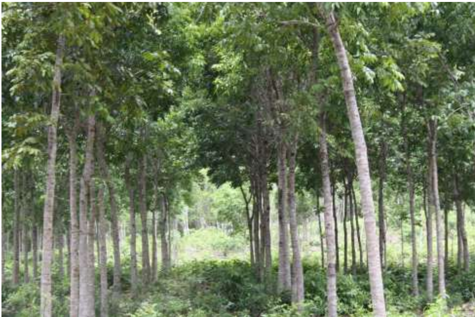
Figura 3. Parcela 10 en el predio La chiquita