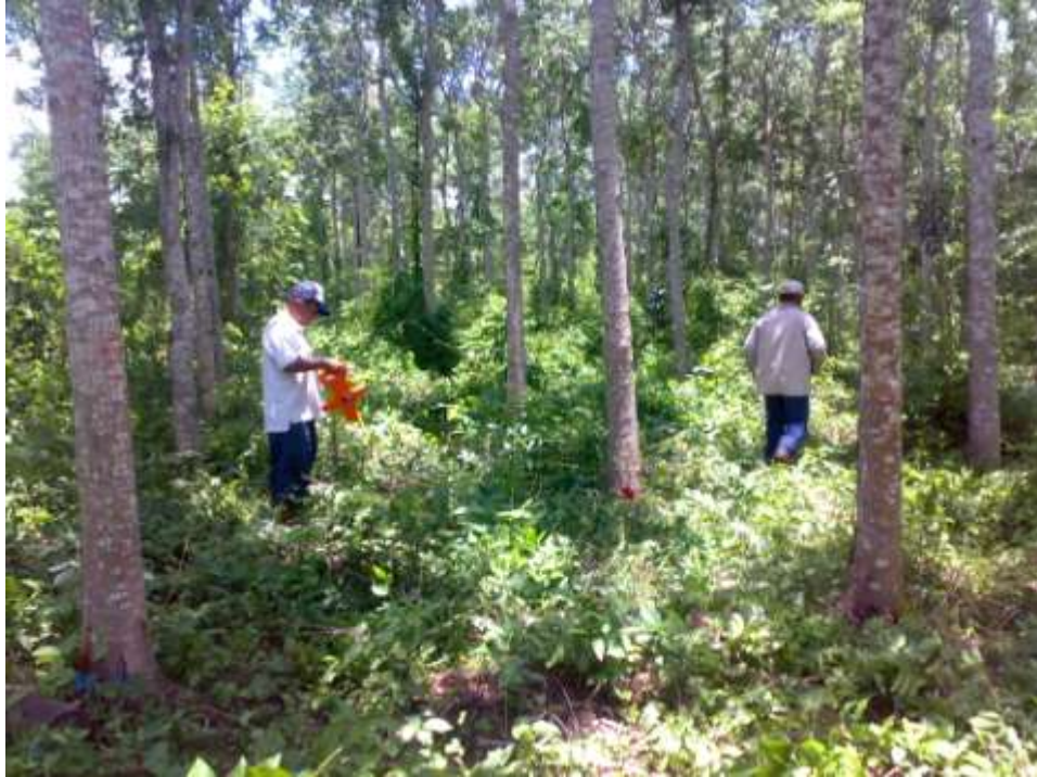
Figura 2. Parcela Modulo 1 S.1 en el predio de Agromarañón